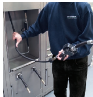
carretes auto retractiles