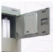
puerta de carrete bloqueable