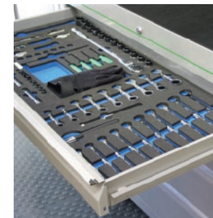
armarios para herramientas de servicio pesado