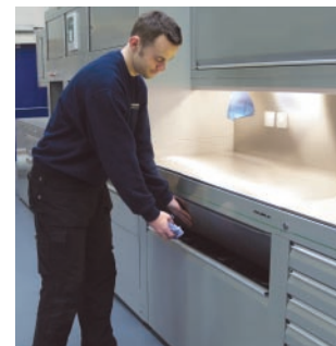
Papelera de reciclaje