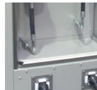
bandejas de goteo removibles