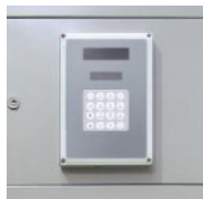
teclado numérico opcional de monitorización