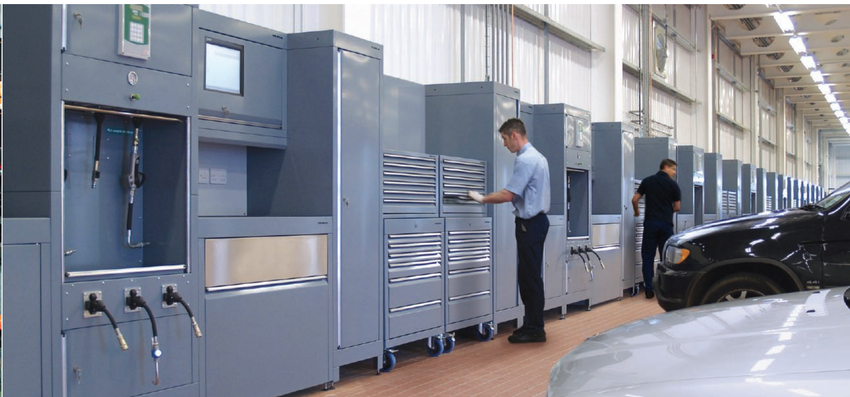
Sistemas integrados de taller