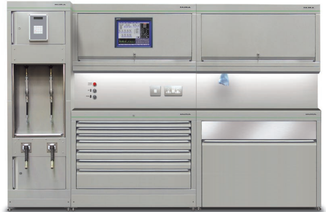
Típico compartimiento de servicio individual