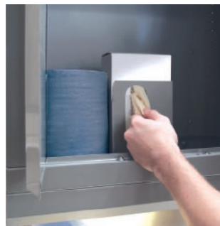
Dispensador de guantes